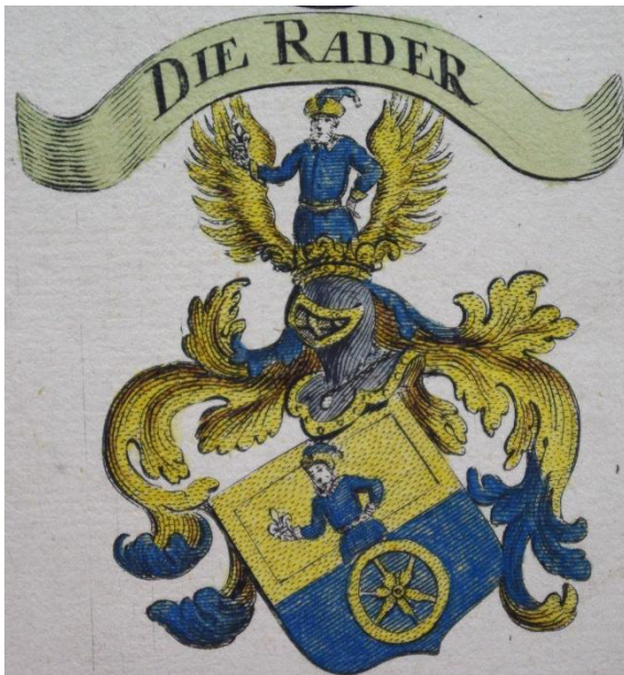
Das Wappen der Familie Rader im Wappenbuch der historischen Lindauer Sünzengesellschaft von 1735. Original im Stadtarchiv Lindau; Repro: Karl Schweizer.

Auf diesem Zettel standen folgende Anschuldigungen: „Der Bürgermeister Rader ist ein leichtfertiger Schelm und ein Hurer und Ehebrecher, der alle seine Mägde zu Huren gemacht hat, der ganzen Welt ein Gräuel ist. Wie kann ein solcher bestrafen, der selber ein Hurer ist? Er gehört nicht auf das Rathaus, sondern darunter, dort wo man das Gefängnis hat, das aufgeblasene Tier.“ 4