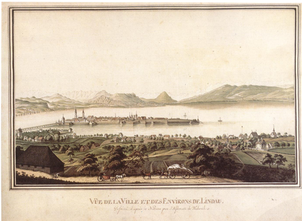
Blick auf die Insel Lindau und das nördlich gelegene Bodenseeufer vom Hoyerberg aus um das Jahr 1800, kolorierter Umrissstich von J. Aschmann aus Thalweil mit dem Titel „Ansicht der Stadt Lindau und der Umgebung“.

Über Lindau verliefen bereits seit der Mitte des Mittelalters unterschiedliche Handelsrouten, die auch von den Fern- und Großhändlern in der Stadt rege genutzt wurden. So reichten die Verbindungen über Innsbruck beispielsweise in den Salzburger Raum und über den Brenner nach Oberitalien und Venedig. Nach Norden wurde mit Kaufleuten in beispielsweise Wangen, Ravensburg, Ulm, Frankfurt, Memmingen und Augsburg gehandelt. Im französischen Lyon waren Lindauer Fernhändler am dortigen Handelshaus deutscher Kaufleute beteiligt. Hinzu kamen die Schweiz als Handelsplatz sowie über den städtischen „Mailänder/Lindauer Boten“ eine Postverbindung mit dem Raum Mailand und darüber hinaus.