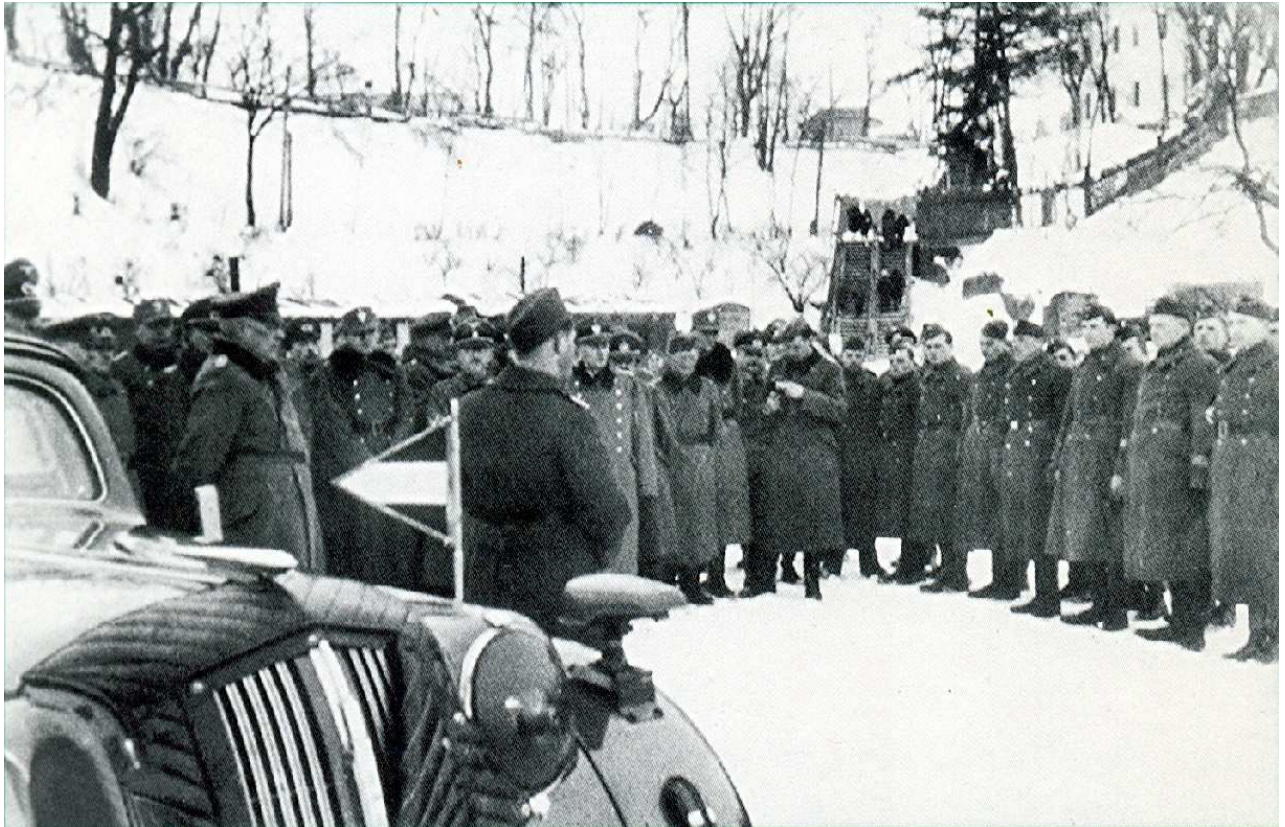
Eine Befehlsausgabe für das Einsatzkommando 8 von SS, SD und NS-Polizei in der Nähe der sowjetischen Stadt Mogilev im Winter 1941/42.